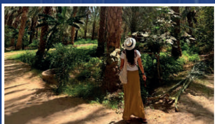
PASEO EN CALESA POR EL OASIS PALMERAL