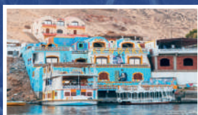
PUEBLO NUBIO (CRUCERO NILO)