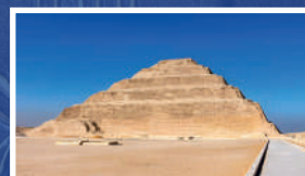
SAQQARA (EL CAIRO)