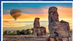
GLOBO AEROSTÁTICO EN LUXOR (CRUCERO NILO)