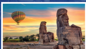
GLOBO AEROSTÁTICO EN LUXOR (CRUCERO NILO)