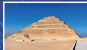
SAQQARA (EL CAIRO)