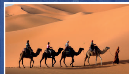
PASEO EN CAMELLO EN DOUZ