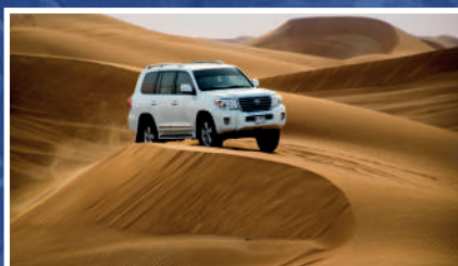
EXCURSION 4X4 CHEBIKA Y TAMERZA (STAR WARS)