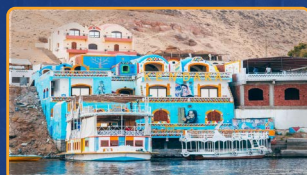
PUEBLO NUBIO (CRUCERO NILO)