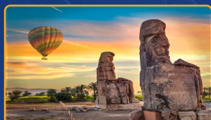
GLOBO AEROSTÁTICO EN LUXOR (CRUCERO NILO)