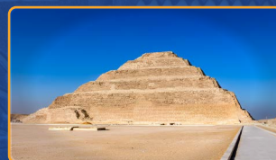
SAQQARA (EL CAIRO)