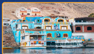
PUEBLO NUBIO (CRUCERO NILO)