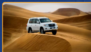
EXCURSION 4X4 CHEBIKA Y TAMERZA (STAR WARS)