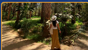
PASEO EN CALESA POR EL OASIS PALMERAL