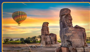
GLOBO AEROSTÁTICO EN LUXOR (CRUCERO NILO)