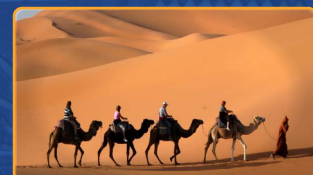
PASEO EN CAMELLO EN DOUZ