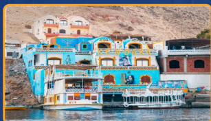
PUEBLO NUBIO (CRUCERO NILO)